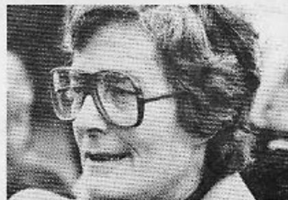
Bitten Verge, Frem.

Det må blive Holbæk. De har de bedste chancer og kan jo selv afgøre det. Næstved er på vej frem så de får sikkert sølv, og Køge må nøjes med bronze. For mig at se må B 1909 ned i anden div.