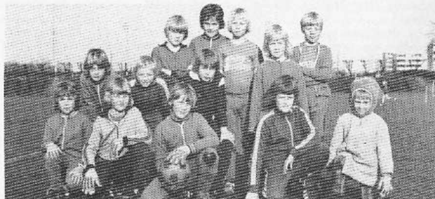
Miniputterne der slog Fårevejle med 21-0.

... Vi er med overalt i byggeriet bl.a. med: