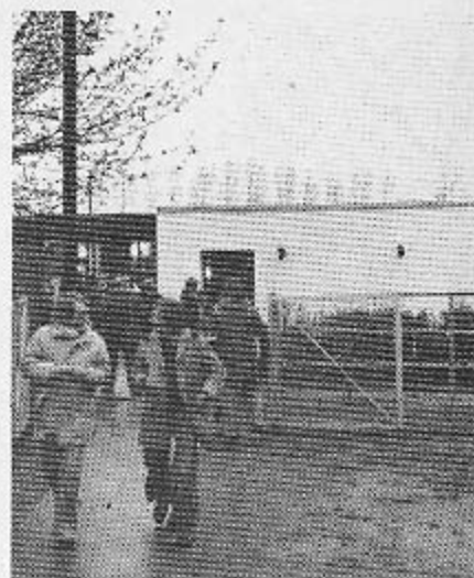
Her ved den vestlige fløj påtænker HB&I udvidelsen af klubhuset.

Man henstiller fra kontrollørside til publikum om at have lige penge ved tælleapparaterne til divisionskampene, da dette ville lette ekspeditionen både for publikum og kontrollører. Svend Larsen.